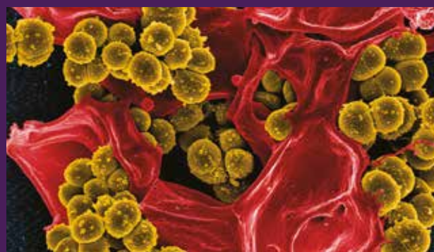
Scanning electron micrograph of methicillin-resistant Staphylococcus aureus .

Umělá inteligence používaná k předpovídání potenciálních nových antibiotik v průkopnické studii. Vědcům se i díky umělé inteligenci podařil největší objev antibiotik v historii. Pomocí strojového učení se pokusili najít v rozmanitém spektru všech mikrobů světa něco užitečného, co by se mohlo vyrovnat současným antibiotikům. Link na publikovaný příspěvek najdete na isp21.cz .