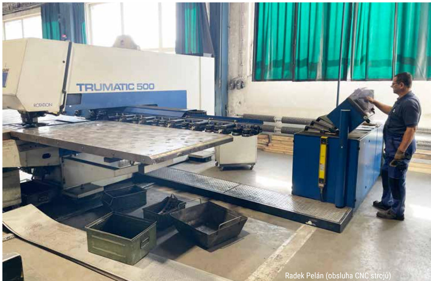
Radek Pelán (obsluha CNC strojů)