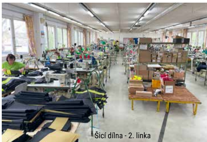
Šicí dílna - 2. linka

V prosinci 2003 družstvo obdrželo certifikáty CQS a IQNet, které potvrzují, že má zavedený Systém managementu jakosti na výrobu pracovní, profesní a ochranné konfekce, prádla a vycházkových oděvů podle norem ČSN EN ISO 9001:2016.