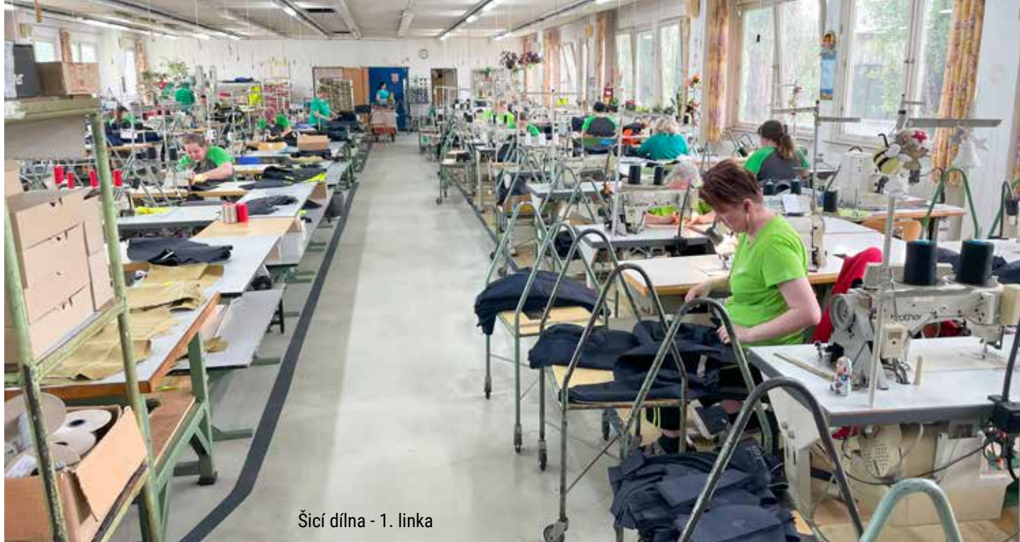
Šicí dílna - 1. linka

V současné době se věnuje družstvo tomu, co jeho zaměstnanci umí nejlépe, a to výrobě oděvů. Pracovní oděvy vyráběné v družstvu VKUS Frýdek-Místek splňují vysoké nároky nejen na kvalitu, ale i požadavky zákazníků na vzhled a užité vlastnosti s uplatněním v různých výrobních odvětvích.