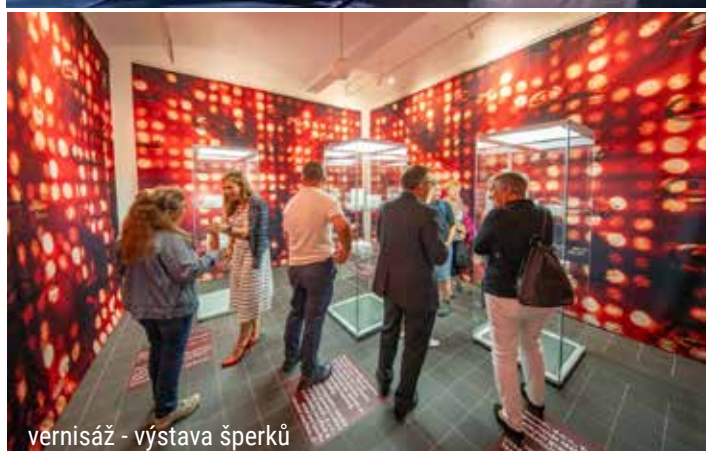
vernisáž - výstava šperků

V Turnově, stejně tak jako vloni, se velké oblibě těšily Dětské dílničky v Galerii Granát, kde si malí návštěvníci mohli prověřit svou trpělivost a pečlivost při výrobě drobného šperku. Při prohlídce galerie bylo možné nahlédnout pod pokličku zlatnického řemesla, které má v Turnově bohatou tradici. Dětské dílničky byly otevřeny každé prázdninové úterý a pátek.