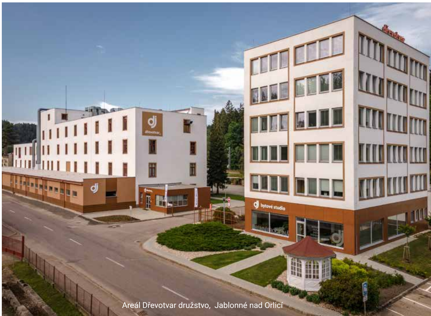
Areál Dřevotvar družstvo, Jablonné nad Orlicí

Pokud nepatříte zrovna mezi odborníky ve světě designu a nevyznáte se v technických parametrech, zkrátka nedovedete výrobci sdělit svoji konkrétní představu, Dřevotvar družstvo vám může připravit 3D vizualizaci rozmístění nábytku s ohledem na dispozici vašeho konkrétního prostoru.