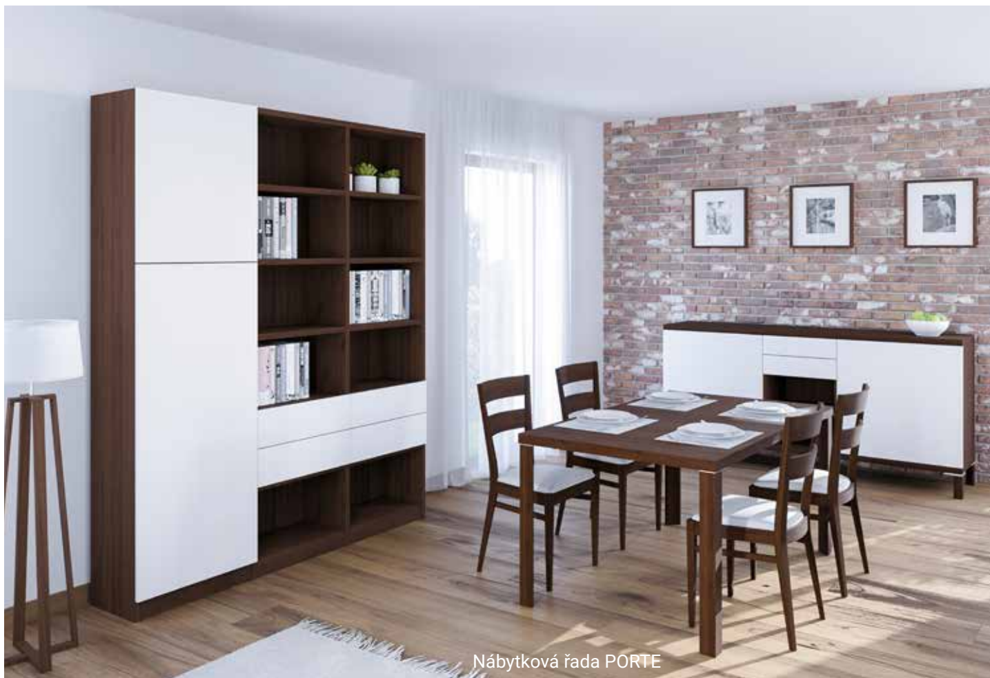
Nábytková řada PORTE

mickým mlecím mechanismem CrushGrind® s možností regulace hrubosti mletí. Díky keramice, která je odolnější a tvrdší než ocel, mlýnky umelou i tvrdé druhy koření jako jsou badyán, hřebíček a další. Při používání keramického mechanismu není chuť a vůně koření ovlivněna žádnou oxidační nebo chemickou reakcí. Nabídka zahrnuje mlýnky jak klasického vzhledu, tak i moderní designově povedené kousky.