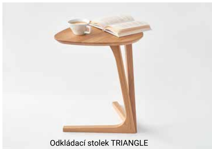
Odkládací stůl TRIANGLE

Odkládací stůl TRIANGLE je praktickým pomocníkem, který si získává své příznivce stále víc a víc. Je vyroben z dubového masivního dřeva, jeho řemeslné zpracování klade důraz na detaily.