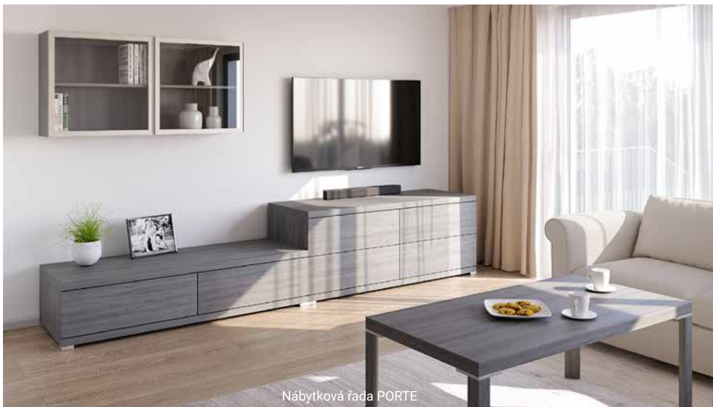
Nábytková řada PORTE

Dřevotvar poskytuje dovoz nábytku přímo k zákazníkovi domů, součástí je samozřejmě výnos až do bytu, odborná montáž a instalace. Svůj vysněný nábytek můžete mít doma již za 4-6 týdnů.