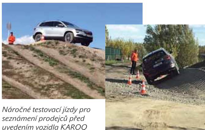
Náročné testovací jízdy pro seznámení prodejců před uvedením vozidla KAROQ

Ve svém segmentu patří KAROQ mezi nejdelší a zároveň má jednu z nejširších karoserií. Silnou stránkou je také rozvor náprav. Pro řadu zákazníků je velmi důležitým údajem objem zavazadelníku, což je zároveň věc, na které si Škoda dlouhodobě zakládá. Ať už si vezmete Octavii, nebo třeba Kodiaq, vždy dostanete obří objem prostoru určeného pro přepravu nejrůznějších věcí. KAROQ na tom není jinak objem základního zavazadlového prostoru je 521 L!