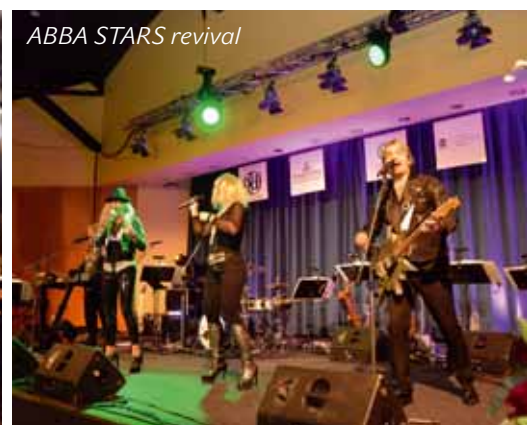
ABBA STARS revival