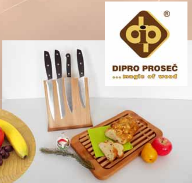
Praktické vánoční dárky z družstva DIPRO Proseč...