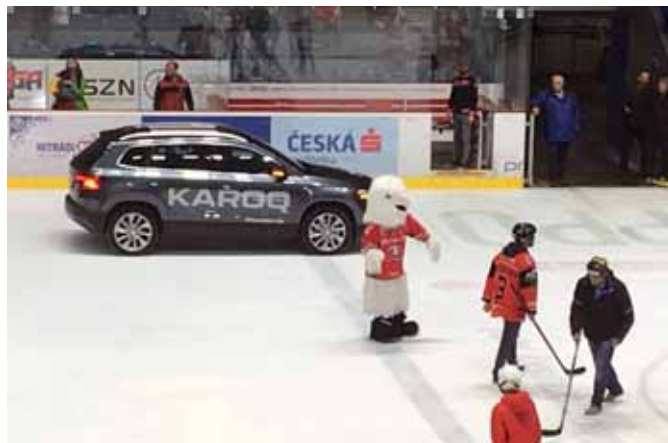
Představení vozidla KAROQ při utkání mezinárodní EBEL ligy - utkání znojemských Orlů

modelu je, že uspokojí širokou veřejnost a že není pouze vozidlem pro majetné. Model KAROQ přichází coby náhrada úspěšného Yetiho. Oproti němu je větší a samozřejmě v mnoha ohledech modernější. Už pouze tyto skutečnosti budou na českém trhu pro spoustu lidí důvodem, proč tohoto nováčka automaticky pořídit. KAROQ ale nabízí řadu pádných argumentů také při srovnání s přímou konkurencí.