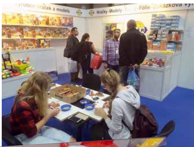
Vlevo: Miroslav Baťa