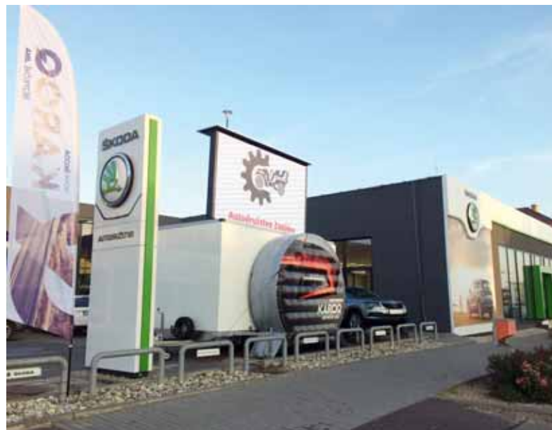
Upoutávka před autosalonem při představení vozidla KAROQ - včetně promítání a představení vozidla na velkoplošné TV

Ve svém segmentu patří KAROQ mezi nejdelší a zároveň má jednu z nejširších karoserií. Silnou stránkou je také rozvor náprav. Pro řadu zákazníků je velmi důležitým údajem objem zavazadelníku, což je zároveň věc, na které si Škoda dlouhodobě zakládá. Ať už si vezmete Octavii, nebo třeba Kodiaq, vždy dostanete obří objem prostoru určeného pro přepravu nejrůznějších věcí. KAROQ na tom není jinak objem základního zavazadlového prostoru je 521 L!